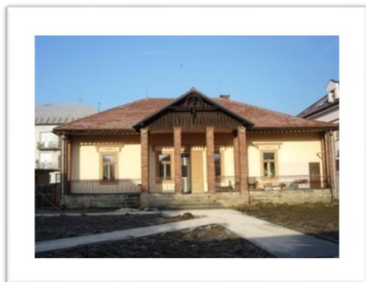
Centre de jour «Club 75»

Le gérant du centre est le Centre urbain de la culture et du sport KNM , dont le siège se trouve dans la Maison de la culture à Kysucké Nové Mesto. Les locaux du Centre de jour « Club 75 » sont prêtés gracieusement aux structures urbaines non lucratives et aux différentes associations pour mettre en œuvre des réunions, des expositions, des actions de société, y compris pour les donateurs de sang bénévoles et d'autres événements. www.kysuckenovemesto.sk/klub-75.html