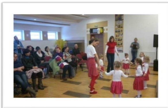
Centre de loisirs de St. Jacques

Le Centre de loisirs se trouve dans un bâtiment commun avec le bureau de paroisse, le Centre pastorale de paroisse et le restaurant paroissial.